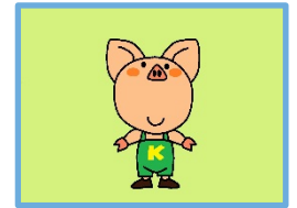
キャラクター「きるとん」